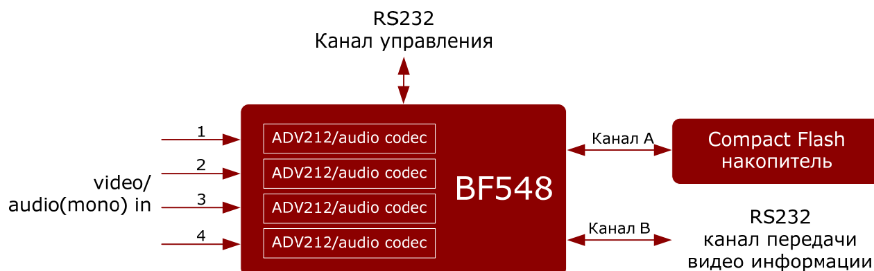
Рисунок 1 Общая структура устройства

Необходимо предусмотреть долгосрочную автономную работу с удалённым управлением и снятием данных по низкоскоростному радио каналу.